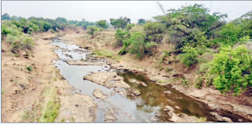
नदी के सूखने का सीधा असर आसपास के गांवों में पेयजल स्रोतों पर पड़ रहा है। नवागांव, घोबघट्टी, डोमसरा, पिपरघुंटी, खरहट्टा, डुल्लापुर, अखरा सहित कई गांवों में हैडपंप का जलस्तर तेजी से नीचे चला गया है, जिससे अधिकांश हैडपंप बंद हो चुके हैं। कुछ स्थानों पर ही सीमित पानी उपलब्ध है, जिससे किसी तरह निस्तारी की जा रही है।