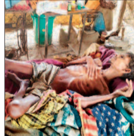
स्वास्थ्य अमले ने नहीं ली सुध

एक तरफ सरकार वनांचल के विकास और आदिवासी कल्याण के बड़े-बड़े दावे कर रही है। वहीं दूसरी ओर जिले के मानपुर क्षेत्र के घने जंगलों से एक ऐसी तस्वीर सामने आई है, जो सत्ता और प्रशासन की संवेदनहीनता को उजागर करती है। पिछले 8 महीनों से एक आदिवासी युवक अपनी खाट पर पड़े-पड़े तिल-तिल कर मरने को मजबूर है, लेकिन न तो जिला प्रशासन की टीम वहां पहुंची और न ही स्वास्थ्य विभाग के किसी अमले ने सुध ली।