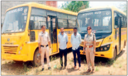
दोनों बसों को मोटरयान अधिनियम के प्रावधानों के अंतर्गत जब्त कर पुलिस थाना मोहारा में सुरक्षा की दृष्टि से सुरक्षित खड़ा किया गया है। प्राप्त जानकारी के अनुसार इससे पूर्व भी श्रीवेद पब्लिक स्कूल मोहारा की एक बस के विरुद्ध कार्रवाई की जा चुकी है, किंतु वाहन संचालकों द्वारा आवश्यक दस्तावेजों के नवीनीकरण के प्रति अपेक्षित तत्परता नहीं दिखाई गई।

जांच के दौरान श्रीवेद पब्लिक स्कूल मोहारा की स्कूल बस सीजी-08-एजी-1365 एवं सीजी 08-एजी-1366 में वैध फिटनेस, बीमा, प्रदूषण प्रमाण पत्र एवं कर (टेक्स) के दस्तावेज लंबित थे। संबंधित अनियमितताओं के कारण दोनों बसों को मोटरयान अधिनियम के प्रावधानों के अंतर्गत जब्त कर पुलिस थाना मोहारा में सुरक्षा की दृष्टि से सुरक्षित खड़ा किया गया है। प्राप्त जानकारी के अनुसार इससे पूर्व भी श्रीवेद पब्लिक स्कूल मोहारा की एक बस के विरुद्ध कार्रवाई की जा चुकी है, किंतु वाहन संचालकों द्वारा आवश्यक दस्तावेजों के नवीनीकरण के प्रति अपेक्षित तत्परता नहीं दिखाई गई।